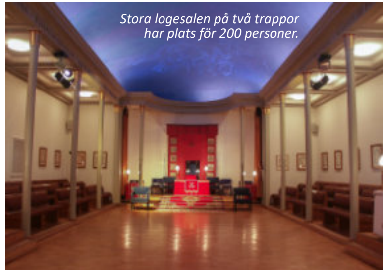
Stora logesalen på två trappor har plats för 200 personer.