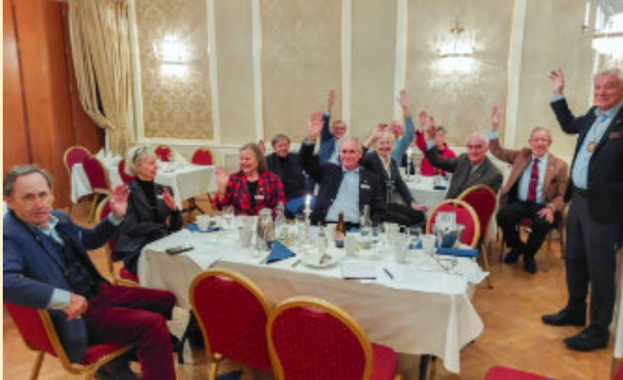
Handen upp för gemensam programverksamhet. Årsmötet var positivt till förändringen.