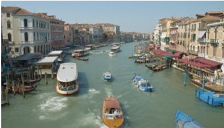
Venedig är en turiststad med stora problem

Venedig har stora problem. Staden är grundlagd på träpålar nerslagna i de djupa lerlagren utan att nå fast berg, vilket gör att staden sjunker 20 cm på 100 år. Pålarna ruttnar och sjunker ner i leran medan kraftiga skyfall gör att vattennivån höjs.