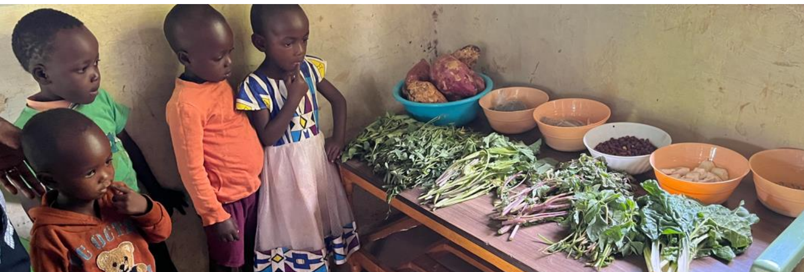
Barnen demonstrerar nyttiga grönsaker.