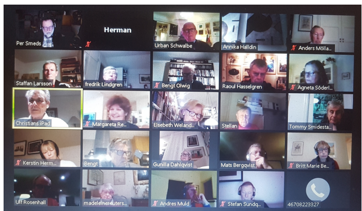
Så här kan det se ut på ett klubbmöte.